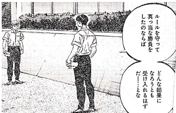
出典「BUNGO-ブンゴ」 二宮裕次氏 集英社 より

「気持ちが変化した文を見つけ、最初の5文字を答えなさい。」のような設問は頻出ですので、心情をぐりぐりしながら読むと良いです。