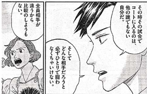
出典「あさひなぐ」 こざき亜衣氏 小学館 より

「無理だと諦める前に、できることを探してやってみよう!」と思ってくれたら嬉しいです。