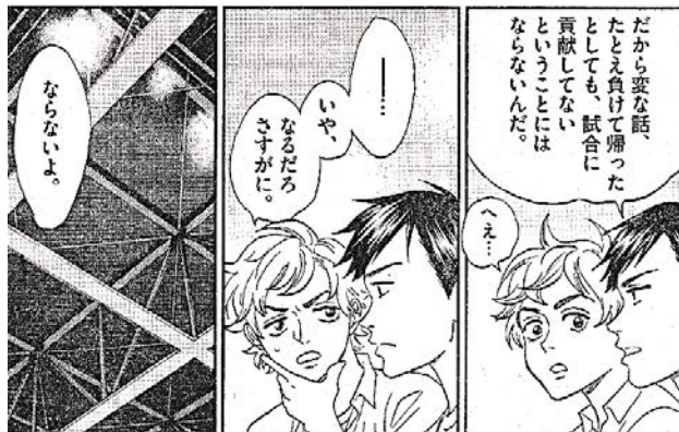
出典「あさひなぐ」 ござき亜衣氏 小学館 より

「調べるハードル」は、私が子供のころよりも、かなり低いはずで。あなたならできるはずで。