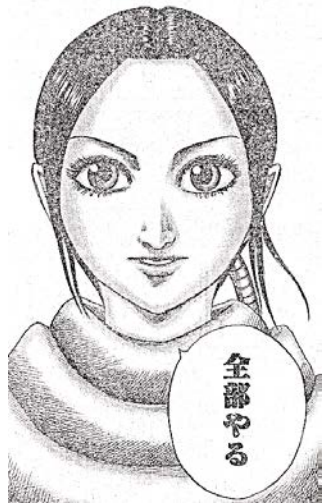
出典「キングダム」 原泰久氏 集英社 より