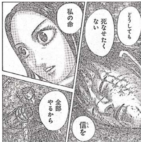
出典「キングダム」 原泰久氏 集英社 より

だからでしょうか、いつもは楽しく笑顔で勉強なのに、いざ入試当日だけ、歯を食いしばって戦う。それって何か違うんじゃないか? こう思うのです。「そうですよね」と思えたあなたは、きっと大丈夫です。自分を信じてそのまま進んでください。「勇気を出した、ほうの勝ち」です。