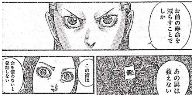
出典「キングダム」 原泰久氏 集英社 より

あなたは誰にも遠慮せず、自分のことを頑張ってください。その努力、私たち大人はちゃんと見ていますよ。