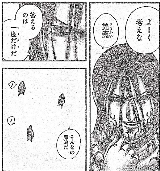
出典「キングダム」 原泰久氏 集英社 より