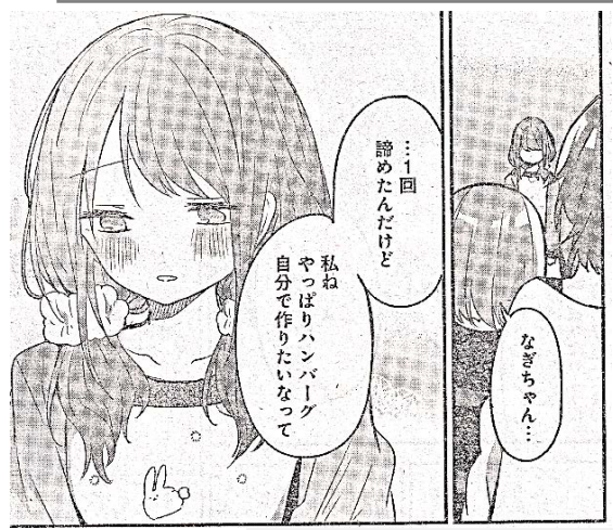
出典「久保さんは僕を許さない」雪森寧々氏 集英社 より

・出雲阿国・菱川師宣・鴨長明。 この3人の読み方、分かりますか？読めない漢字はそのままにせず、調べておきましょう。読めないと（発音できないと）、「これって、何て読むんだっけ？」と考えることになります。 読み方を考えてしまうことで、「思考の流れ」が止まってしまいます。結果、覚えることに集中できません。ですので、発音できない語句は、事前に調べておいてください。全科目共通です。 また読めない事は知らない事、ということになりかねません。先生が「 3x の係数を取るには、逆数をかけるんだよ。」と言った時、係数という漢字は見たことはあっても、発音（けいすう）を知らなかったなら、 3x の 3 を取る方法が、分からないことになります。英語も同じです。 nature のつづりを覚えるときは、「ナチュレ」が良いです。しかし発音（ネイチャー）も覚えないと、リスニングテストで困ります。