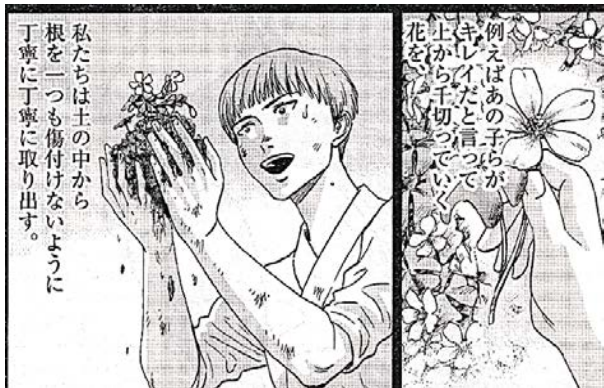
出典「あさひなぐ」 こざき亜衣氏 小学館 より