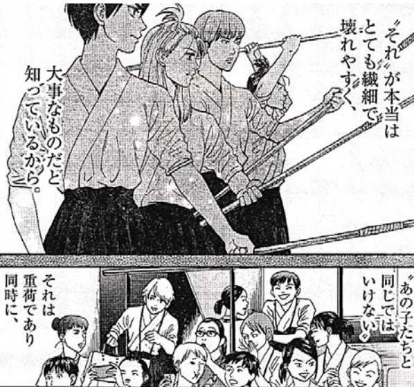
出典「あさひなく」 ごさき亜衣氏 小学館 より

文字や図など、隅から隅まで丁寧に目を配ってください。「あ～、面倒だな」と、思うまでは良いです。でも、その気持ちのまま向き合わずに、覚悟を決めて、切り替えて立ち向かうのです。だって勉強とは、自分との戦いなのだから。