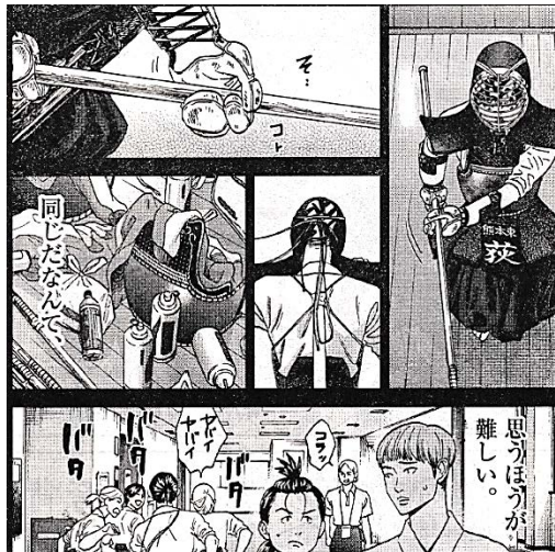
出典「あさひなぐ」 こざき亜衣氏 小学館 より

このときする勉強が、今のあなたの、ベストの勉強法です。そしてそれが、あなたが毎日すべき勉強です。