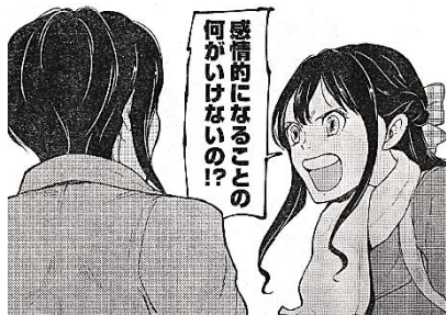
出典「警眼-ケイガン-」 早坂ガブ氏 小学館 より

寄せ書きノート上級者は、語句だけで書きます。歴史の教科書を読んで、「チンギスハンがモンゴル帝国を作った。」のところは、「チンギスハン→モンゴル帝国」と書きます。「フビライハンが孫で、元とした。」のところは、「フビライハン→孫→元」と書きます。そして「なるほど、これが元寇か…」と思いながら、「元寇」と書く。このように、単語を絞って書いてみてください。