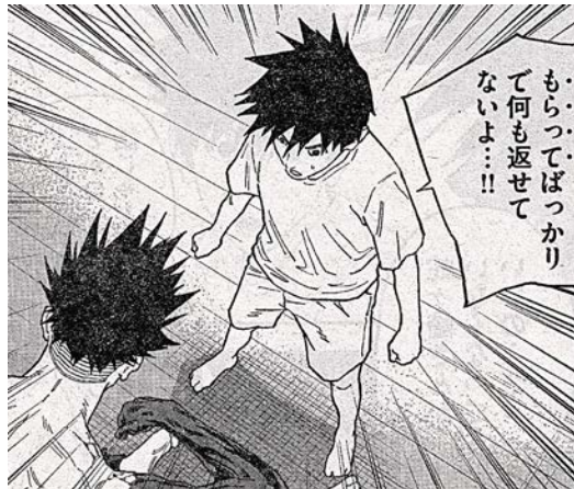
出典「ジャガー」 小学館 原作 金城宗幸氏 漫画 にしだけんすけ氏 より