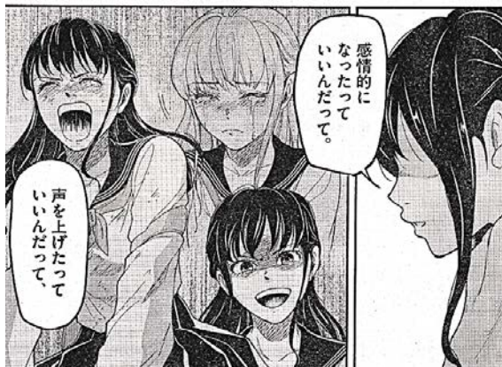
出典「警眼-ケイガン-」 早坂ガブ氏 小学館 より