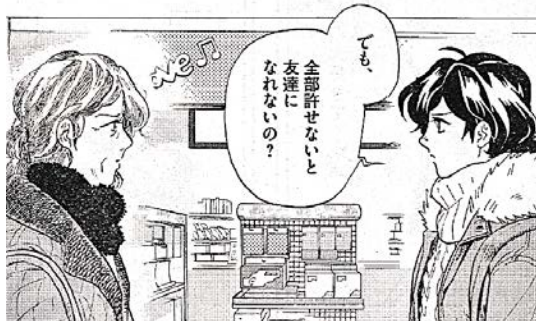
出典「トクサツガガガ」丹羽庭氏 小学館 より

「じゃあ勉強したほうが良いよね」と、話を持っていきたいわけではありません。中途半端にだらだら時間を食いつぶして、青春を過ごすことが、もったい無いと思うだけです。「ゲームと勉強を両立させたい。」ならば、ゲームは好きにだけやりなさい。ただし、2倍お勉強なさい。このプリントを頑張ってくれているあなたには、この約束を守ってほしいです。