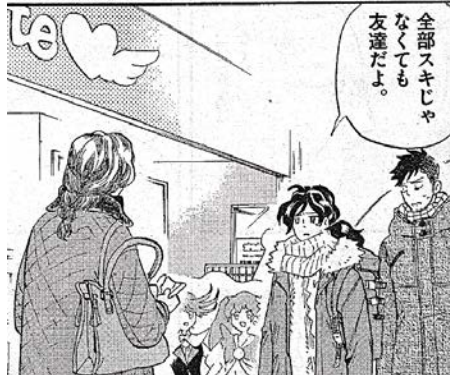
出典「トクサツガガガ」丹羽庭氏 小学館 より

最後に、テスト後だけの「単発反省会」は、開かないでください。テストが上手くいかなかった時、感情的になり、「全然だめだった」と自分を責めてしまうからです。メリットはありませんので、お勧めしません。反省会とは、ダメな自分を公表する会ではないのですから。